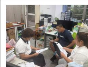
說明:114/10/23 授課-觀課前會議