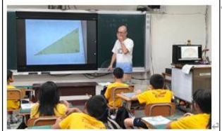
說明：公開課上課情形