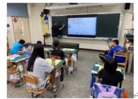
說明：老師先在黑板演示。