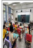
說明:兩名學生出席