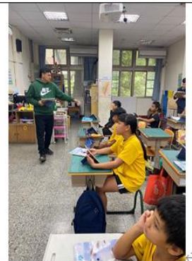
教學觀察-教師教學