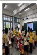
說明:學生-老師皆有動作