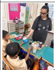
說明:教師詢問學生是如何分類的