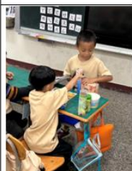
說明:學生實際進行分類活動