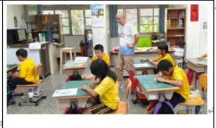
說明：公開課上課情形