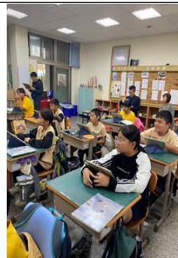
教學觀察-學生學習