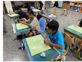
說明：學生進行小數除法的計算。