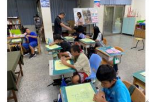
說明：老師課堂巡視。