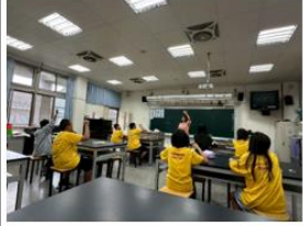
說明:公開授課學生實際操作