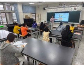
說明:公開授課教師進行講解及示範