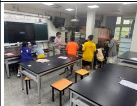
說明:公開授課學生實際操作