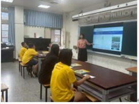
說明:公開授課教師進行講解及示範