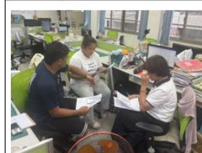
說明:114/10/23 授課-觀課前會議