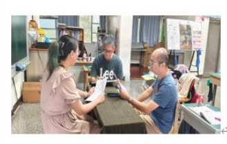
說明：觀課後的檢討會議。