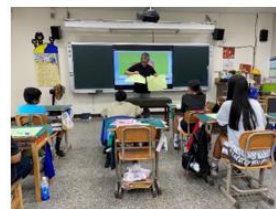
說明：老師展示學生錯誤部分並檢討說明。