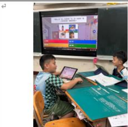
說明：以 Kahoot 呈現單元學習重點