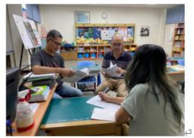
說明：觀課前的會議討論。