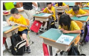
說明：公開課上課情形