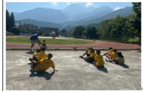
說明:公開授課學生實際操作