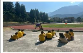
說明:公開授課教師進行講解及示範